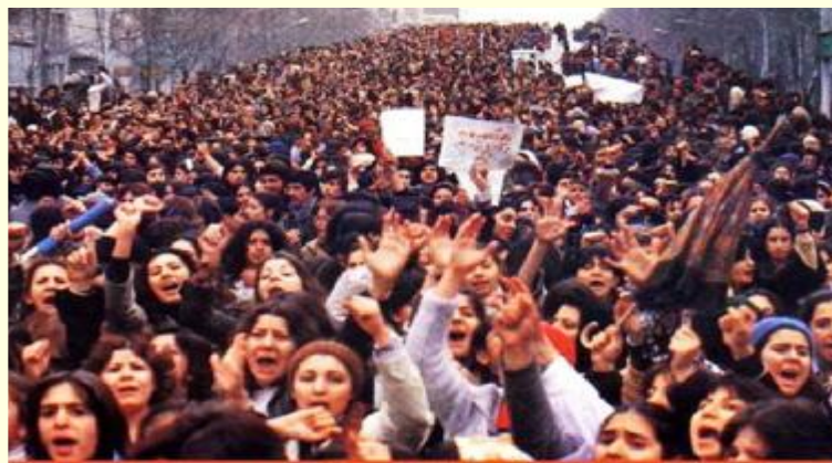
International Women's day demonstrators Tehran, March 8, 1979